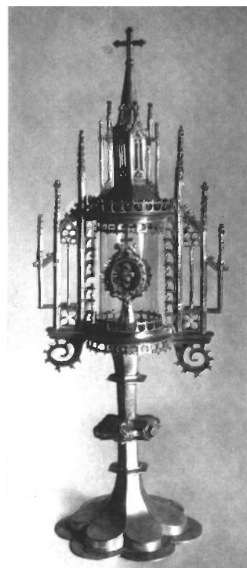
Monstranz in Goldingen

Die Goldinger Monstranz wurde erstmals von D.F.Rittmeyer in ihrem Buch „Die Kirchenschätze im St.Galler Linthgebiet“ (1948) genauer beschrieben: „Spätgotische Monstranz mit Zylinder, h. 51.5 cm, versilberter Guss, eine Art Bronze, sehr gut erhalten, ohne störende Eingriffe oder Zutaten. Vor 1600