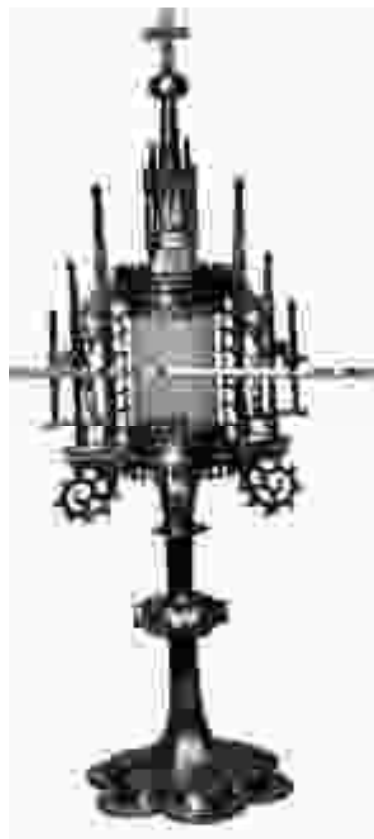
Monstranz LM Bregenz angebl. aus Langen b. Bregenz